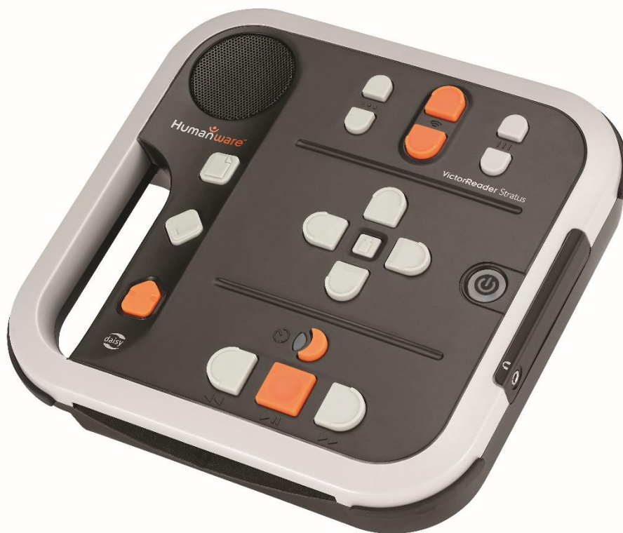
VICTOR READER STRATUS 4 Basic ver 170424